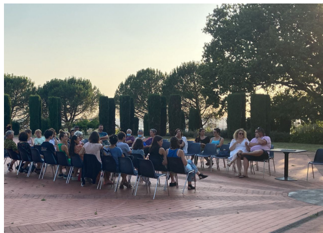
En plein air - Commune de Cenon, Château Tranchère

3 personnes max : 1 comédien, 1 médiatrice, 1 chargée de production