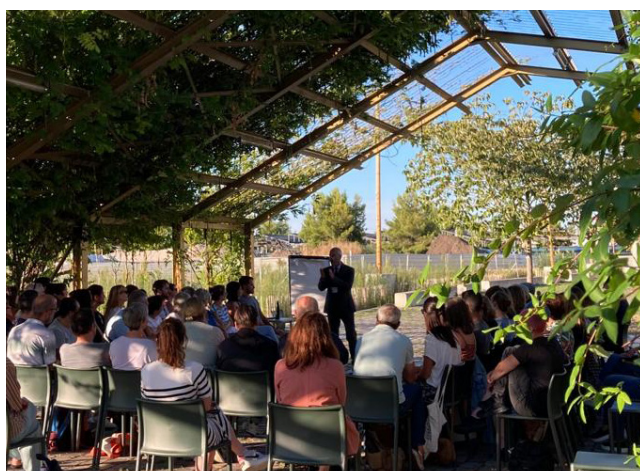
En plein air, sur le parvis des archives de Bordeaux Metropole