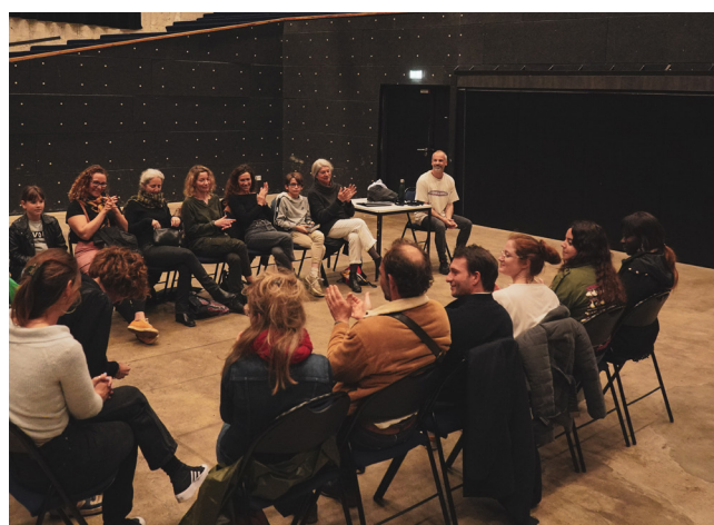
Salle des fêtes - Festival Têtes d'Oranges, Glob Theatre